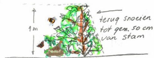
Snoeien andere zijde in het zesde jaar