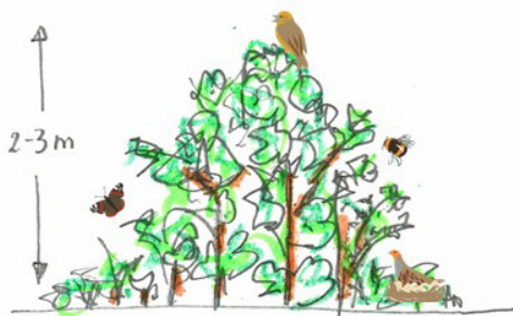
Haag na vier jaar